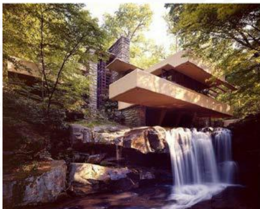
4A. F.L. Wright: La Casa de la cascada .