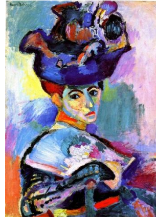
3B. H. Matisse: Mujer con sombrero . 1905.