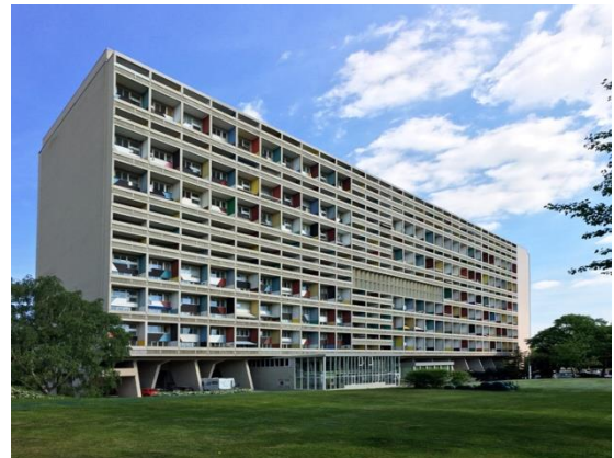
4B. Le Corbusier: Unité d'Habitation .