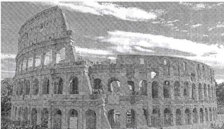
1. El Coliseo de Roma