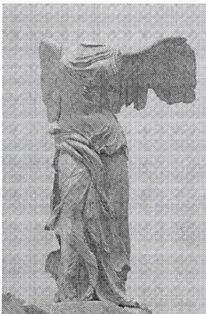
1. Victoria alada de Samotracia