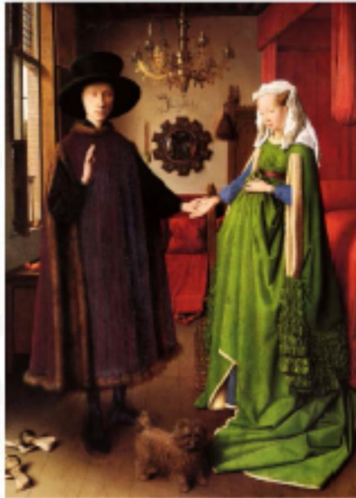
1. El matrimonio Arnolfini